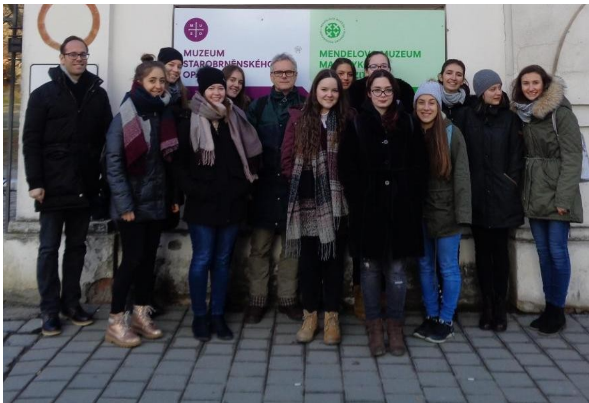
A brnói Mendel-múzeum bejáratánál a zalaegerszegi csapat