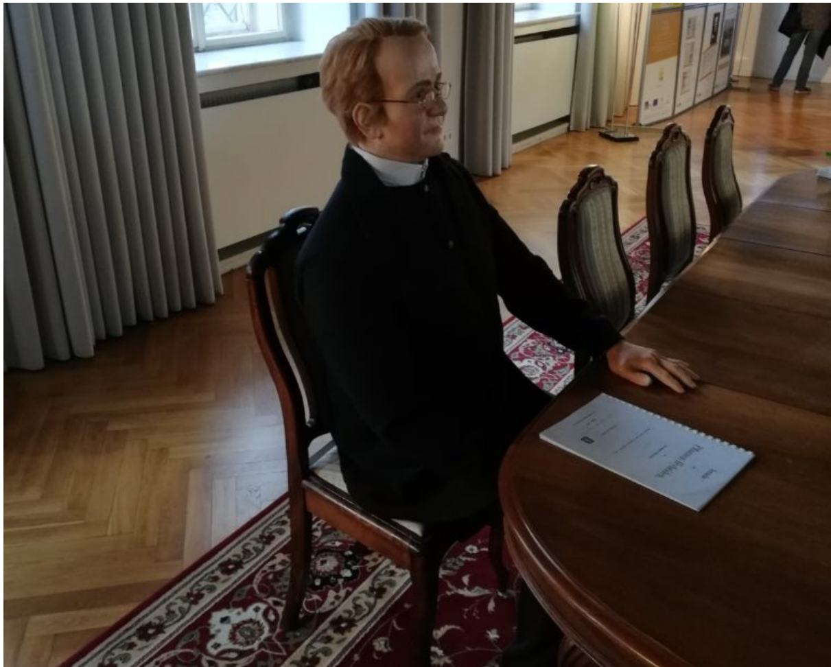
Mendel viaszfigurája

Utolsó napirendi pontunk a Mendelianumnak nevezett információs központ felkeresése volt, ahol Gregor Mendel munkásságát modern örökléstani eszközökkel és technológiákkal rekonstruálták. Egy több méter magas DNS-modellt is láthattunk, de legnagyobb sajnálatunkra azt a liftet, amely egy sejt belsejébe vitt volna minket, technikai okok miatt nem használhattuk. A múzeum kiállítási termeit azonban a Mendelianum igazgatójának, dr. Jirsi Sekeraknak a kíséretében látogathattuk végig. Gregor Mendel 150 éve a termek egyikében tartotta örökléstani előadásait a Brünni Természetvizsgáló Egyesület ülésein, lefektetve velük a genetika alapjait.